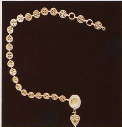
Обр. 2. Запазената горна част на колана с кръгли ажурни звена и медальон