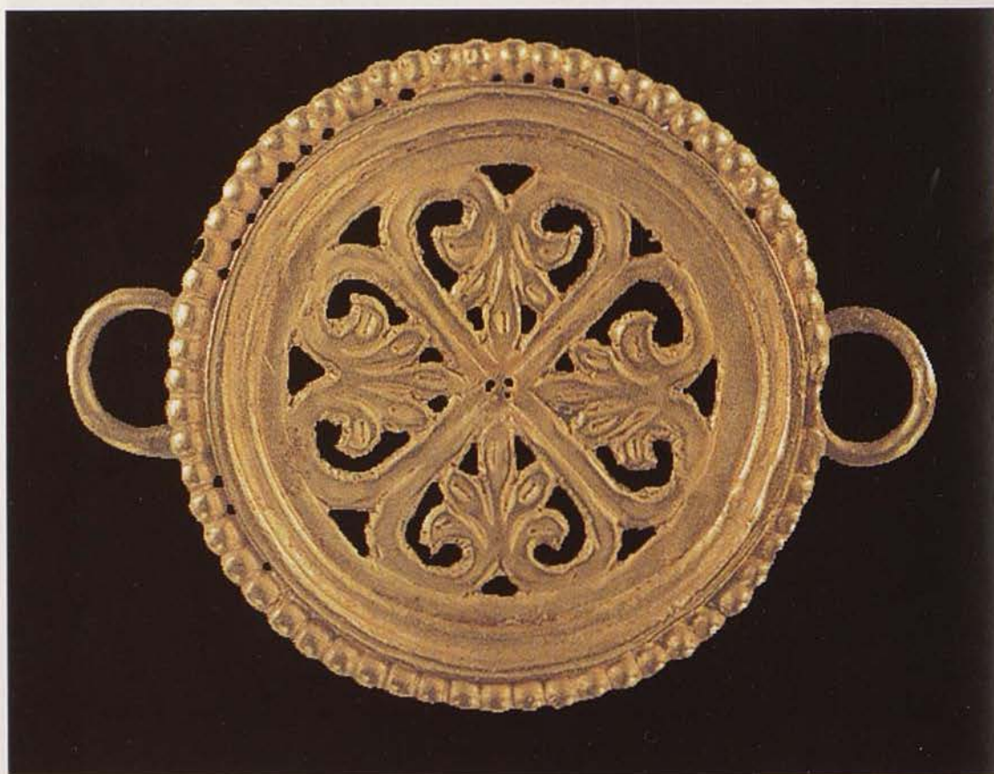
Обр. 14. Ажурно златно звено от колан от Virginia Museum в Ричмонд, САЩ (по Yeroulanou, 1999)