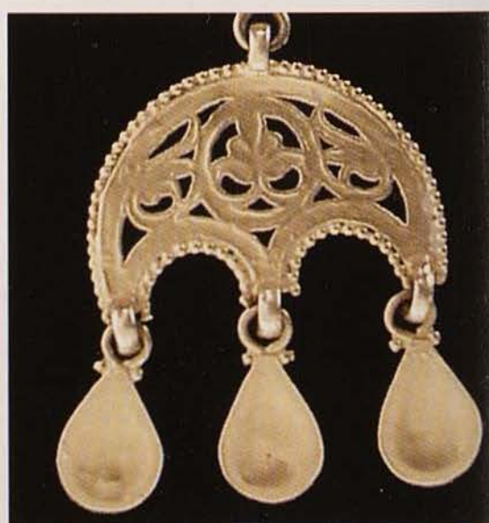
Обр. 10. Висулка лулула (гръб)