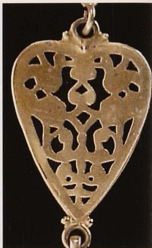
Обр. 8. Сърцевидни звена от колана (гръб)