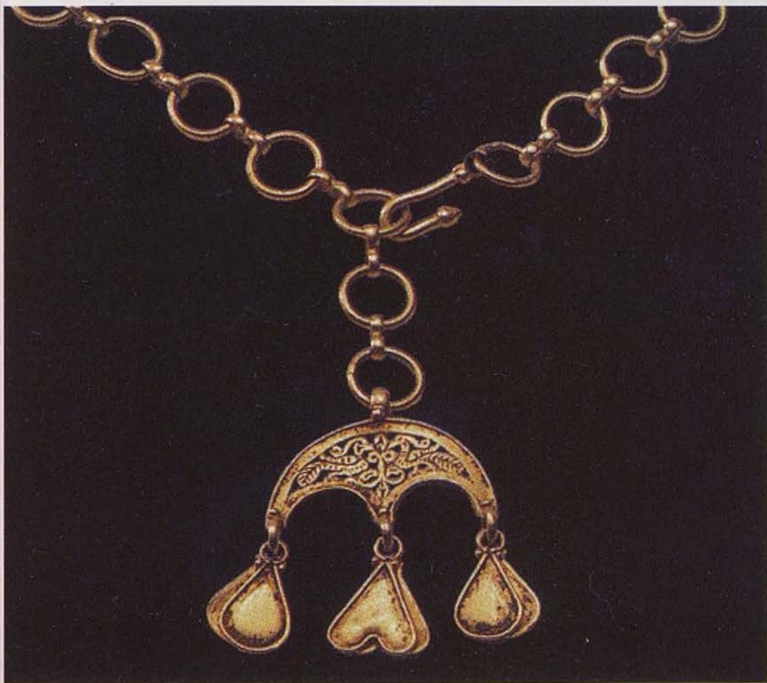
Обр. 16. Висулка лунула на златен колан от Кипър (по Yeroulanou, 1999)