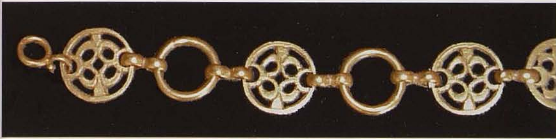
Обр. 4. Кръгли звена от колана (лице)