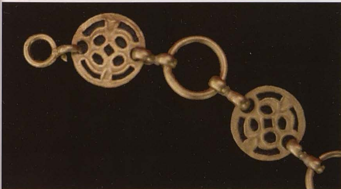
Обр. 6. Крайни ажурни звена с халка закопчалка