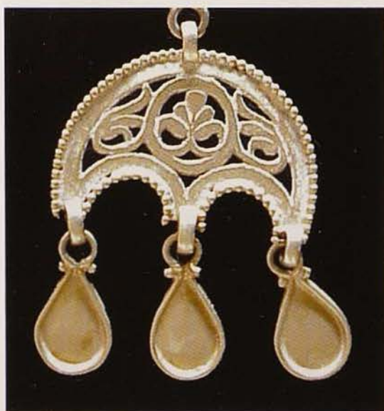
Обр. 9. Висулка лулула в долния край на колана (лице)