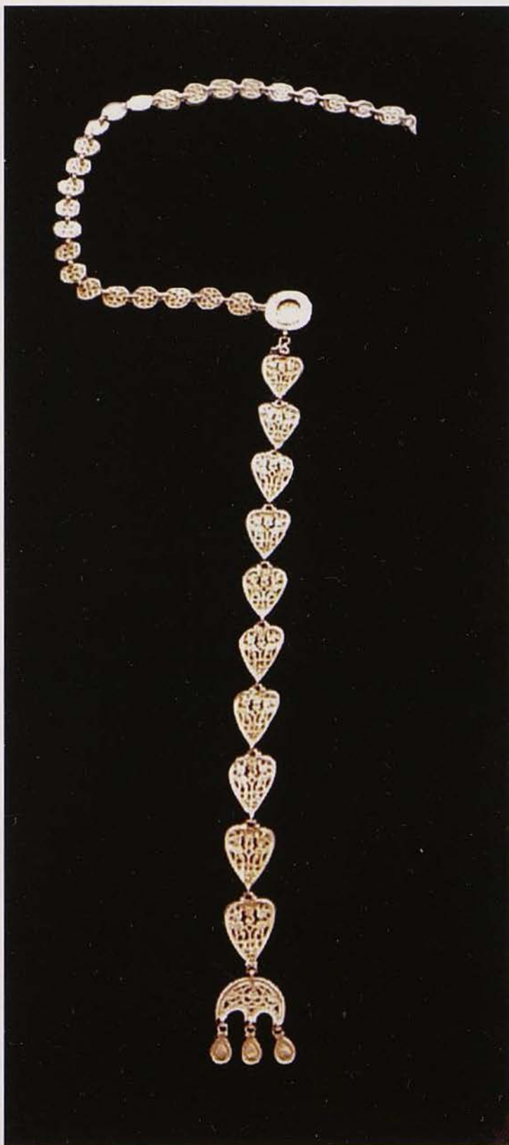
Обр. 1 а. Златен ранновизантийски накит (колан) от Черно море – общ вид