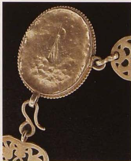
Обр. 11. Свързващ медальон в средата на колана (гръб)