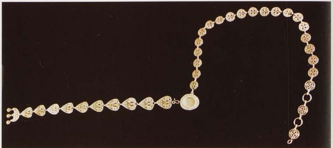
Обр. 1 б. Златен ранновизантийски накит (колан) от Черно море – общ вид