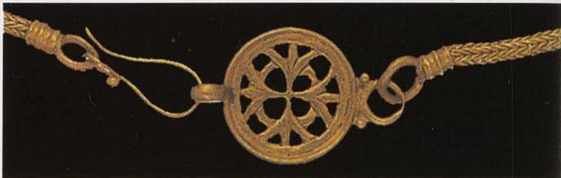
Обр. 13. Ажурна закопчалка на златна огърлица от Източното Средиземноморие (по Rudolph, 1995)