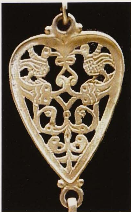
Обр. 7. Сърцевидни ажурни звена от колана (лице)