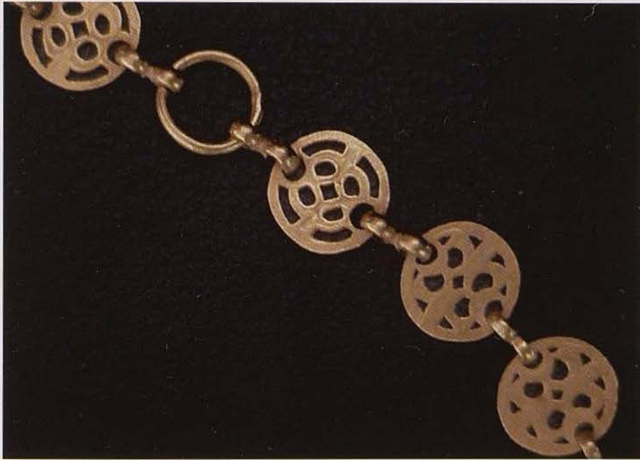
Обр. 5. Кръгли звена от колана (гръб)