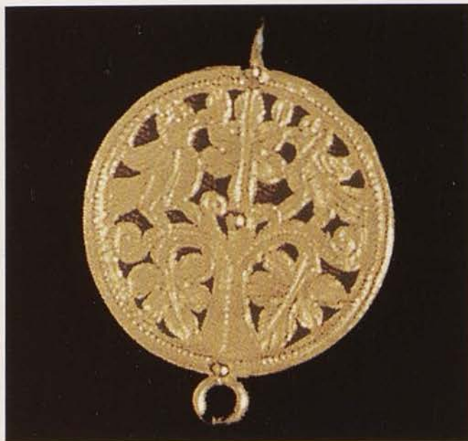
Обр. 15. Ажурно звено с птици от златна огърлица в Римско-германския музей в Майнц, Германия (по Brown, 1984)