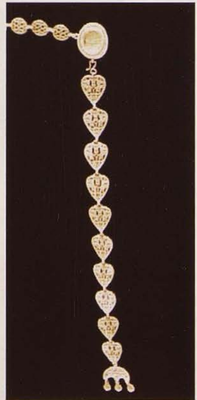
Обр. 3. Долната част на колана със сърцевидни ажурни звена, медальон и висулка лулула